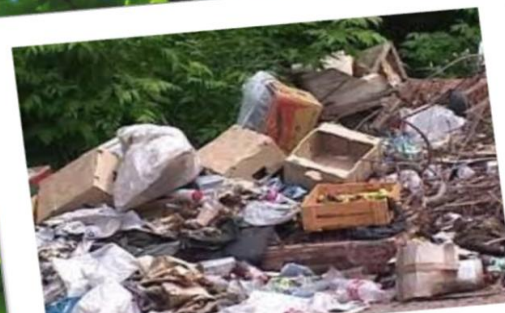
Свалки на природе

В 2013 году на нашей планете было выброшено около трех тонн различного мусора – электронного, пластикового, резинового, бумажного, металлического. На земле появились города-свалки, атмосфера которых пропитана парами ртути серной кислоты, мышьяка, тяжелых металлов. В океане – огромные мусорные острова, дрейфующие по воде. Это реальность сегодняшнего дня.